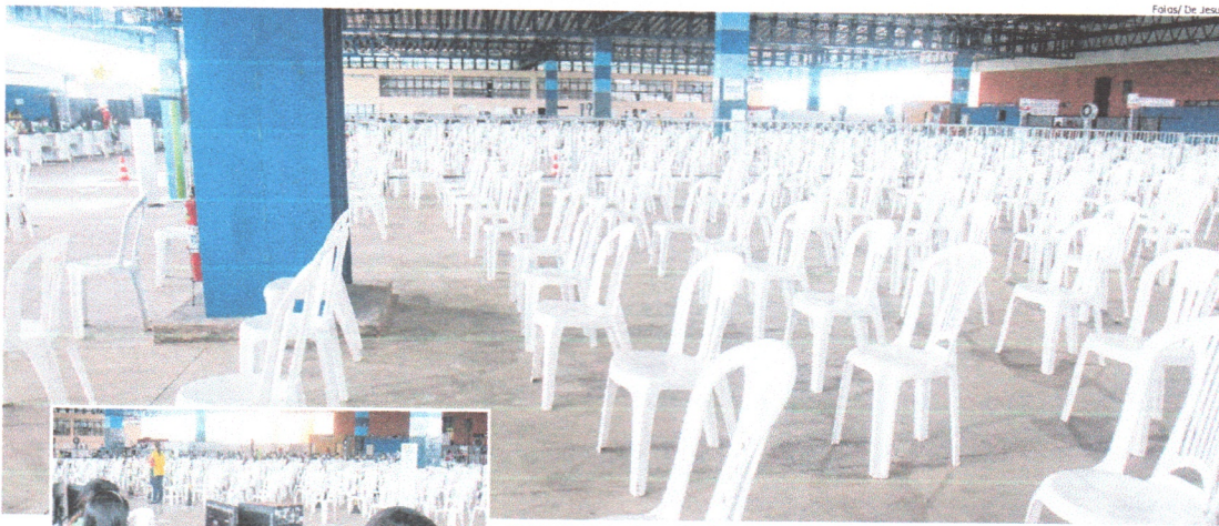
Cadeiras ficaram vazias e os atendentes aguardaram público-alvo, ontem à tarde, no Centro Municipal de Vacinação

No drive-thru na UFMA foi suspenso o atendimento devido ao baixo índice de doses; já no Centro Municipal de Vacinação, as doses não foram aplicadas por falta de público. GERAL 9