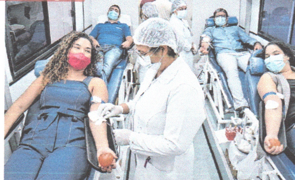
Doadores durante o ato da doação realizado em ônibus equipado e disponibilizado pelo Centro de Hematologia e Hemoterapia do Maranhão (Hemomar), como uma maneira para garantir alta no estoque de sangue do estado, em baixa na pandemia. CIDADES 5