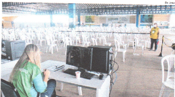
O Centro de Vacinação registrou um pequeno número de pessoas que procuraram doses de vacina

Em pouco mais de uma hora, apenas 20 pessoas foram atendidas. Devido ao movimento baixo, de forma rápida, a pessoa era atendida pelo setor de triagem, que coleta as informações do (a) interessado (a). No CMV, de acordo com a Semus, estão sendo vacinados profissionais de saúde que atuam em setores de urgência e emergência de unidades públicas e privadas incluídas na estrutura de controle epidemiológico da Covid-19.